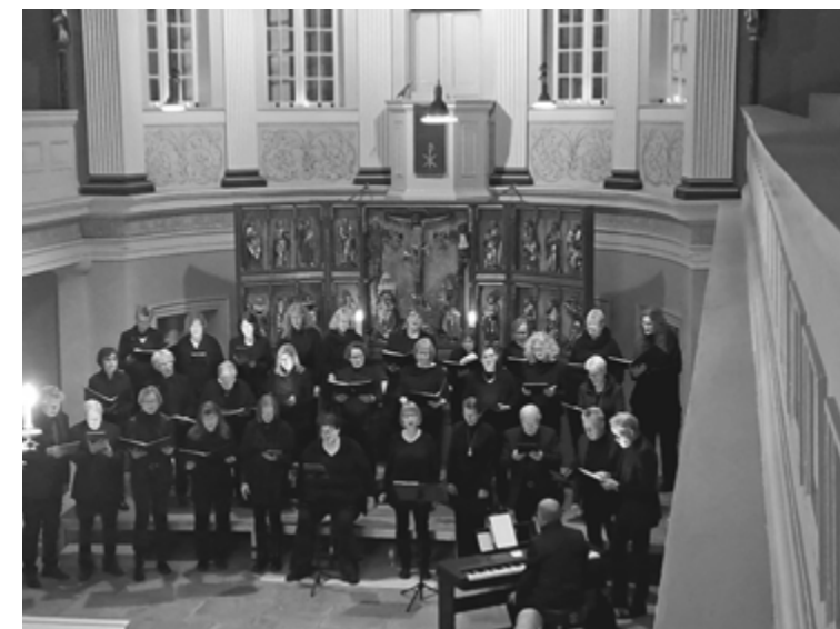
Chorkonzert Rätzlingen am 2. Advent