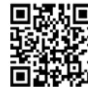
Hier geht's zum Jahresprogramm der Evangelischen Jugend

Gemeinsam feiern wir Andacht, singen und beten und stellen uns die Frage nach unserem „Point of View“ auf die Passion Jesu – aber auch auf unser eigenes Leben, unsere Zeit, die Passion der Menschheit.