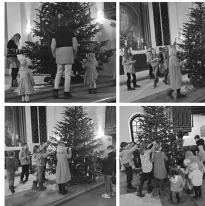
Schmückegottesdienst in Molzen - 3. Advent