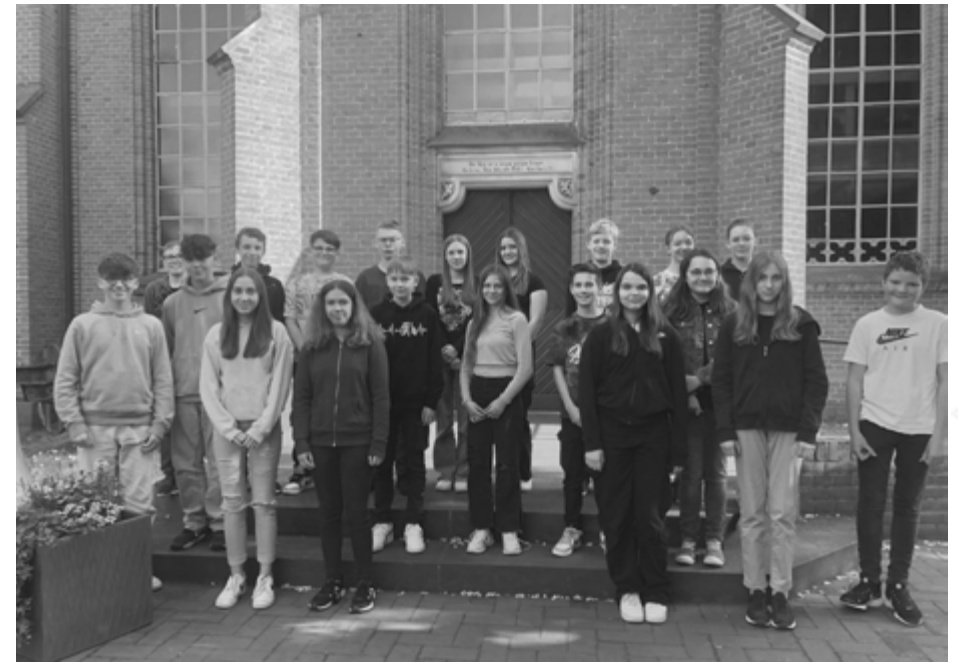
Konfirmandinnen und Konfirmanden der Kirchengemeinden Rosche und Rätzlingen.